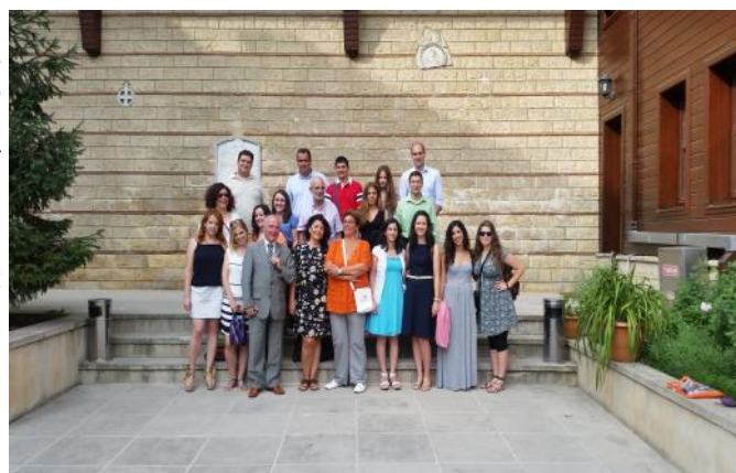
Πριν γίνουν δεκτοί από την Α.Θ.Π. τον Οικουμενικό Πατριάρχη

Το όλο εγχείρημα επέτυχε με την άριστη κατανόηση από τις νέες και τους νέους της σημασίας του Προγράμματος, της θερμής φιλοξενίας που επιφυλάχτηκε από όλους τους Ομογενειακούς φορείς με πρώτη την Κοινότητα του Σταυροδρομίου και την Παιδούπολη της ν. Πρώτης. Το εγχείρημα επίσης απέδειξε ότι η νέα γενιά των Κωνσταντινουπολιτών κατανοεί την σημασία των προσπαθειών του επαναπατρισμού στις πατρίδες των γονέων τους. Εξάλλου το Πρόγραμμα επίσημα έχει τον τίτλο «Επιστροφή στην Πόλη» και στα τουρκικά "İstanbul'a Dönüş". Θα συνεχίσει η προσπάθεια για την αξιοποίηση των αποτελεσμάτων αλλά και την διεύρυνση του Προγράμματος.