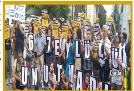
Διαδήλωση στην Πόλη

(β) την Παρασκευή 4/9/2015 πραγματοποιήθηκε η Ημερίδα με θέμα τους ψυχικούς μηχανισμούς με τους οποίους σε μια κοινωνία στοχοποιείται μια ομάδα με την καλλιέργεια προπαγάνδας μίσους. Στην Ημερίδα που οργανώθηκε από την Οι.Ομ.Κω. συμμετείχαν ως ομιλητές διακεκριμένοι ψυχίατροι και ψυχολόγοι και οι οποίοι παρουσίασαν τους διάφορους μηχανισμούς που επηρεάζουν τους θύτες αλλά και τις επιπτώσεις στον ψυχικό κόσμο των θυμάτων σε πράξεις μαζικής βίας όπως των