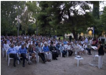
Εγκαίνια της Έκθεσης στην Αθήνα

την διάρκεια ενεργειών βίας δωρίθηκαν από τον ναύαρχο Φαχρί Τσοκέρ στο Ίδρυμα Ιστορίας της Τουρκία, με την προϋπόθεση της μεταθάνατο χρήσης τους. Εκτός από τα ελληνικά η Ταινία έχει μεταγλωττιστεί στα τουρκικά και αγγλικά. Εξετάζεται επίσης να μεταγλωττιστεί στα γαλλικά και γερμανικά.