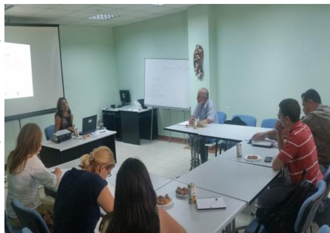
Παρακολούθηση Σεναρίων Επιχειρηματικότητας