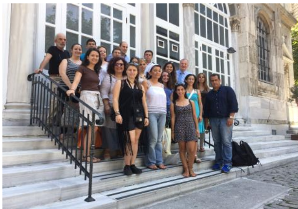
Οι νέες και νέοι στην Αγία Τριάδα Σταυροδρομίου

Πραγματοποιήθηκε με επιτυχία το Πρόγραμμα που είχε ανακοινωθεί στο προηγούμενο μας Δελτίο. Μετά από ανοικτή πρόσκληση, υποβλήθηκαν 27 υποψηφιότητες απ' όλη την Ελλάδα και την Τουρκία. Απ' αυτές επιλέχθηκαν οι 20 από την αρμόδια επιτροπή που είχε ορίσει το Δ.Σ. Στη συνέχεια την περίοδο 27/7-8/8/2015 οι επιλεγέντες παρακολούθησαν μαθήματα για την ιστορία της Ρωμιοσύνης της Πόλης και τις δραστηριότητες της Οι.Ομ.Κω. και τους σκοπούς του προγράμματος που συμμετέχουν. Επίσης την περίοδο αυτή παρακολούθησαν εντατικά μαθήματα τουρκικής γλώσσας. Οι νέες και νέοι με καταγωγή από την Πόλη και την Ίμβρο, μετέβησαν στην Πόλη την 9/8/2015. Την περίοδο 10/8-19/8/2016 οι