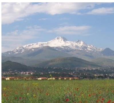
Το Αργαίο Όρος της Καππαδοκίας

Το Διοικητικό Συμβούλιο της Οικουμενικής Ομοσπονδίας Κωνσταντινουπολιτών εύχεται το έτος 2016 να φέρει υγεία, ευτυχία και ειρήνη