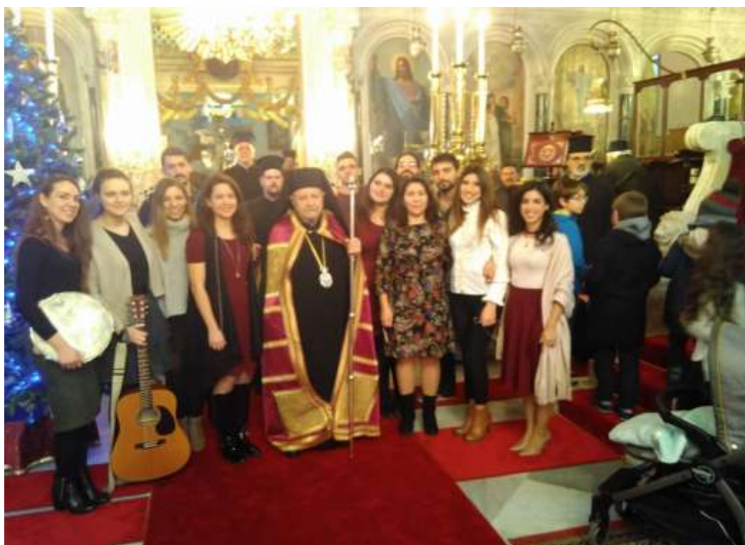
Στον Καθεδρικό Ιερό Ναό Αγίας Τριάδος Χαλκηδόνος με τον Γέροντα Σεβασμιώτατο Μητροπολίτη Χαλκηδόνος κ. Αθανάσιο κατά την Πρωτοχρονιάτικη Εορτή Νέων