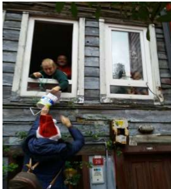
Κάλαντα σε Ρωμαϊκό σπίτι με την χρήση του «καλαθιού από το παράθυρο»