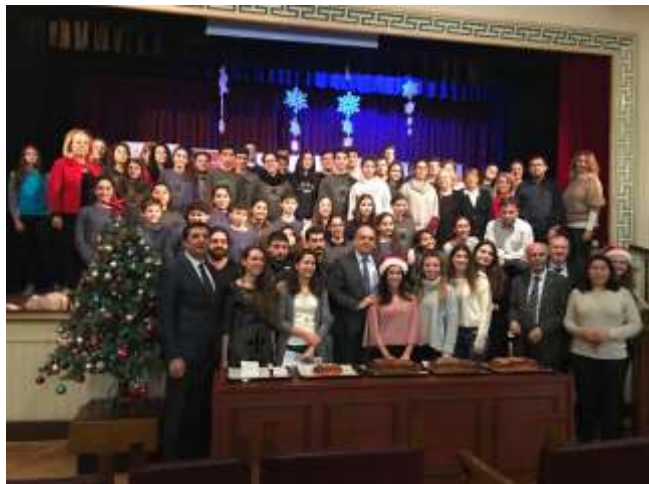
Στην Ζωγράφειο Σχολή του Πέρα