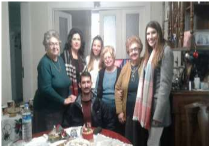
Σε ομογενειακό σπίτι της Πριγκήπου