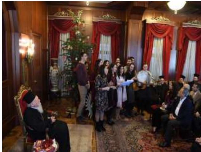
Οι νέοι της ΟΙ.ΟΜ.ΚΩ. με την Α.Θ.Π. Οικουμενικό Πατριάρχη κ.κ. Βαρθολομαίο στο Φανάρι

Μέλος της Γραμματείας των Νέων Εθελοντών της ΟΙ.ΟΜ.ΚΩ.