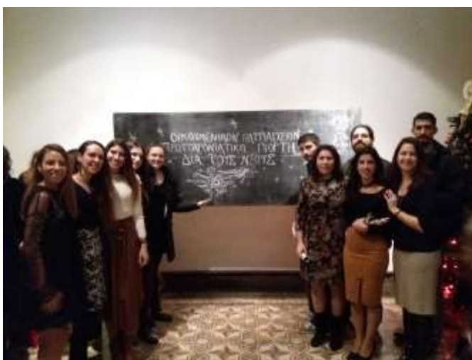
Στη Σχολή Γαλατά στη Εορτή Νεολαίας του Οικουμενικού Πατριαρχείου