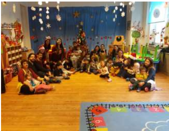
Παιδικός Σταθμός Αγίας Τριάδος Σταυροδρομίου