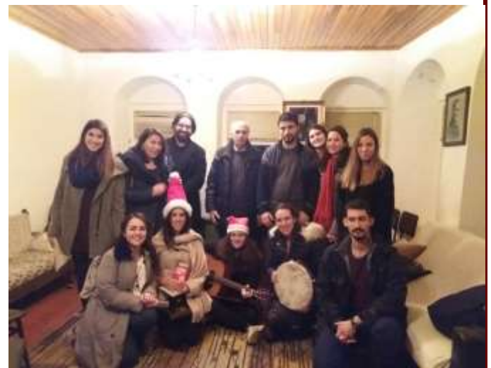
Στον Άγιο Νικόλαο Υψωμαθειών