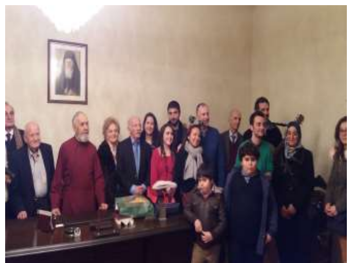
Στην Κοινοτική Αίθουσα Παναγίας Εισοδείων με τον Σεβ. Μητροπολίτη Τρανουπόλεως κ. Γερμανό