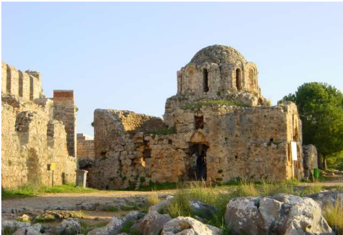
Ο Ιερός Ναός Αγ. Γεωργίου στο κάστρο της Αλάγιας.

Ο έμφορτος αγαθών έργων, ο προσηνής, καταδεκτικός, προσφιλής, αλλά και αφοσιωμένος και ταπεινός εργάτης του αμπελώνος του Χριστού, ο μέγας ιεραπόστολος Ιεράρχης, που για μισό περίπου αιώνα ταξίδευε μεταξύ ηπείρων και θαλασσών για να λειτουργεί τα επίγεια θυσιαστήρια, να αγιάζονται οι άνθρωποι και να δοξάζεται το όνομα του Κυρίου στην οικουμένη, αναχώρησε για το αιώνιο ταξίδι, όπου θα συναντήσει τον Κύριο της Δόξης στο άγιο και υπερουράνιο και νοερό θυσιαστήριο και θα απολαύσει τους κόπους της θυσιαστικής αγάπης του υπέρ της Εκκλησίας του Χριστού.