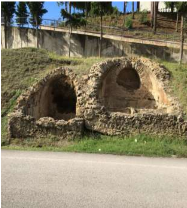
Εικόνα 16. Υπόγειοι τάφοι στη γειτονιά Ada.