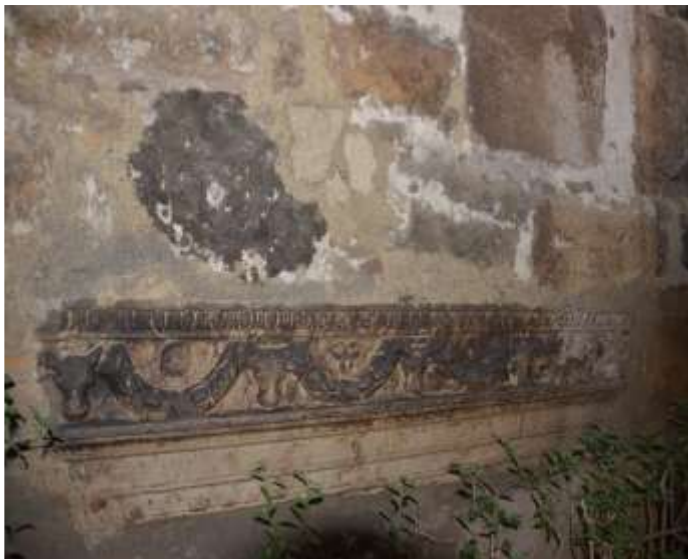
Εικόνα 4. Μια τομή από τα τείχη της Σινώπης

Ο Εβλιγιά Τσελεμπί, στο έργο του, αναφέρει ότι υπάρχουν οκτώ πύλες στην πόλη: "Πύλη Μειντάν", "Πύλη Κουμ", "Πύλη Τερσάνε", "Πύλη Γενιτζέ", "Πύλη Ταμπαχανέ", "Πύλη Λόντζα", "Πύλη Ουγκρούν" και "Πύλη Ντενίζ" στο Κάτω Κάστρο (Bilici, 2018: 240).