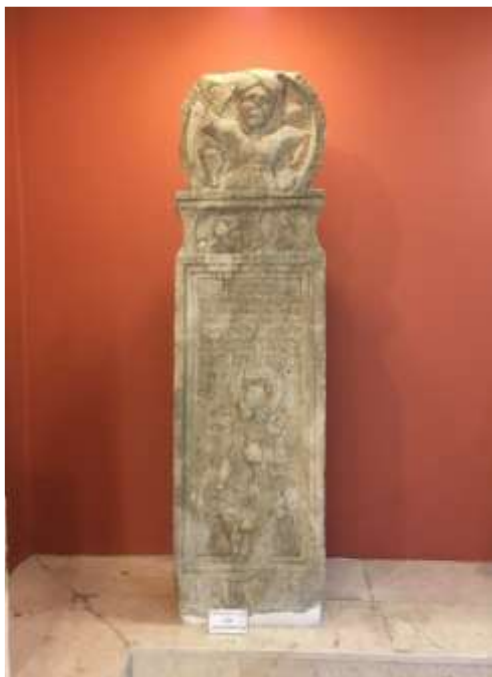
Εικόνα 8. Αίθουσα Εκθέσεων Αρχαιολογικού Μουσείου Σινώπης, Στήλη Ρωμαϊκής Περιόδου.

(Δεξαμενή (Ερείπια Ρωμαϊκών Κτιρίων), 2013: 56).