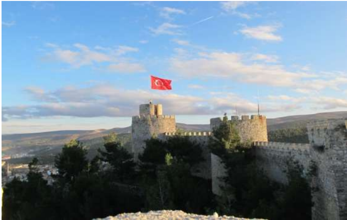
Εικόνα 20. Το φρούριο Boyabat