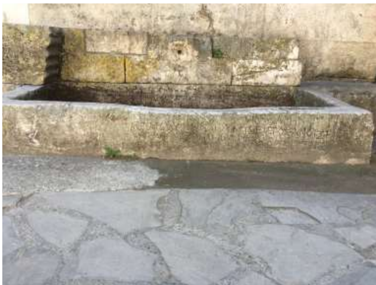
Εικόνα 1. Η λίθινη επιγραφή έμπροσθεν του τεμένους Αλαντίν

Το κέντρο της πόλης της Σινώπης διαθέτει αρκετούς αρχαιολογικούς χώρους για να ικανοποιήσει τόσο τους ντόπιους όσο και τους ξένους τουρίστες. Ενώ σήμερα ορισμένα από αυτά τα αρχαιολογικά ευρήματα είναι ιδιαίτερα γνωστά και προσβάσιμα στους επισκέπτες, ορισμένα δεν είναι. Αν και ορισμένοι αρχαιολογικοί χώροι που θα παρουσιαστούν σε αυτή τη μελέτη βρίσκονται στο κέντρο της πόλης της Σινώπης, ορισμένοι από τους κατοίκους της Σινώπης δεν τους γνωρίζουν, τους έχουν ξεχάσει ή δεν τους έχουν επισκεφτεί για μεγάλο