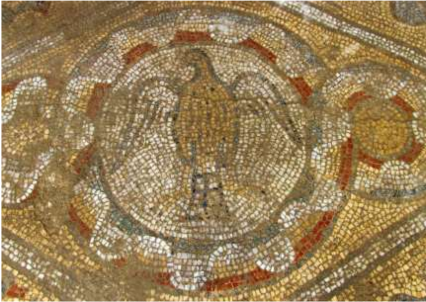
Εικόνα 11. Λεπτομέρεια μωσαϊκού με θέμα τον αετό, Συγκρότημα κτιρίων αρχαίας περιόδου στην περιοχή Μπαλατλάρ της Σινώπης