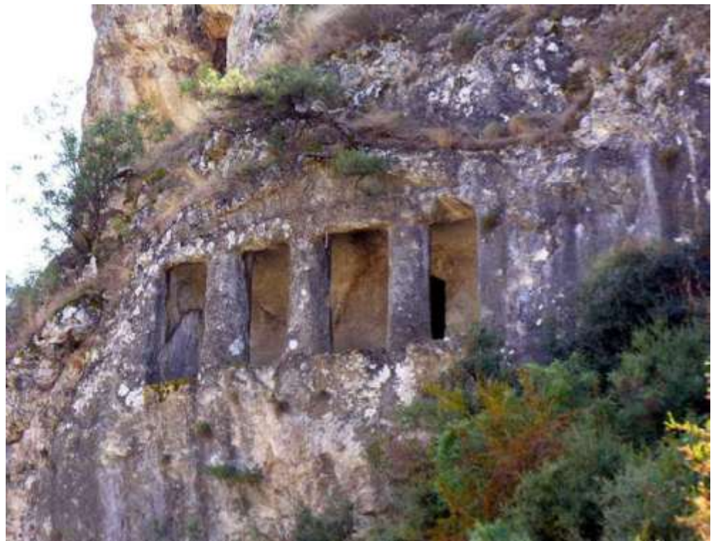
Εικόνα 23. Βραχώδης τάφος Amkbarkaya που βρίσκεται στην πε- ριοχή Durağan