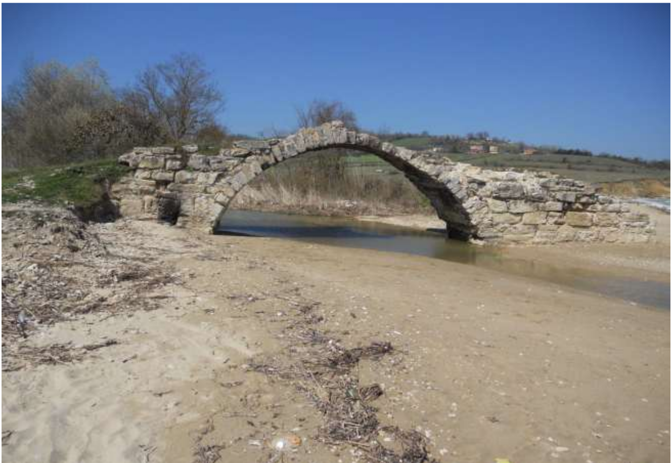
Εικόνα 17. (κάτω) Βυζαντινή γέφυρα στην τοποθεσία Sazlı İmam του χωριού Çiftlik.