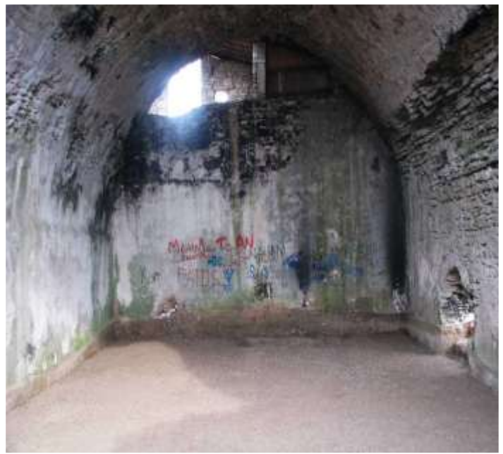
Εικόνα 13: Δεξαμενή νερού ρωμαϊκής εποχής στη γειτονιά Ada.