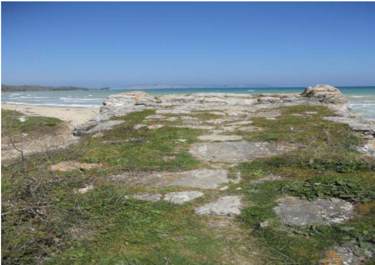
Εικόνα 18. Τα άνω τμήματα της βυζαντινής γέφυρας στην περιοχή Sazlı İmam του χωριού Çiftlik