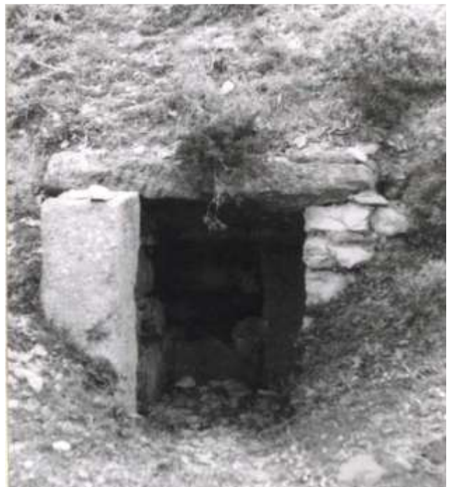
Εικόνα 15. Είσοδος σήραγγας/είσοδος τύμβου Ρωμαϊκής περιό-