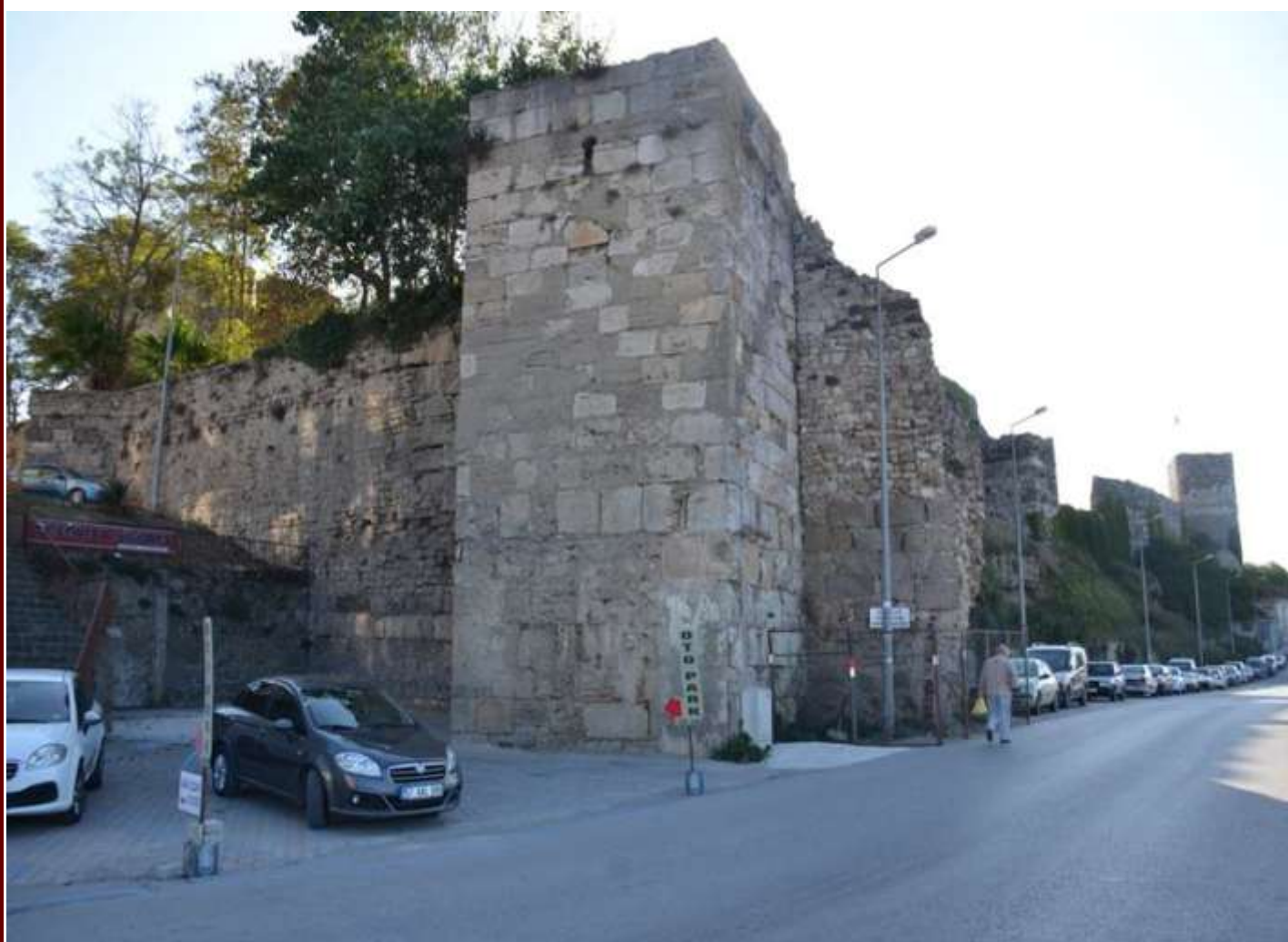
Εικόνα 3. Τα τείχη της Σινώπης

Για παράδειγμα, και τα δύο είναι αντικείμενα της εποχής των Σελτζούκων. Αντικείμενα εποχής. Παραδείγματα περιλαμβάνουν το Τζαμί Αλααντίν στη γειτονιά Τζαμικεμπίρ, το οποίο έχει μήκος 66 μέτρα και πλάτος 22 μέτρα, ορθογώνια κάτοψη και τρεις εισόδους στην αυλή του, η μία εκ των οποίων φέρει μια ενεπίγραφη πέτρα που χρονολογείται από την Αρχαία Περίοδο, και τη Κρήνη του Λιονταριού στη γειτονιά Μειντάνκαπι, η οποία έχει διακόσμηση βουκράνιου που αποτελείται από γιρλάντες από κεφαλές ταύρων και μια ενεπίγραφη πέτρα από την Αρχαία Περίοδο, κατασκευασμένη από επαναχρησιμοποιημένα υλικά, διαστάσεων 2,80 x 3,60 μέτρα (Κρήνη του Λιονταριού, 2013: 34· Τζαμί Αλααντίν, 2013, 24).