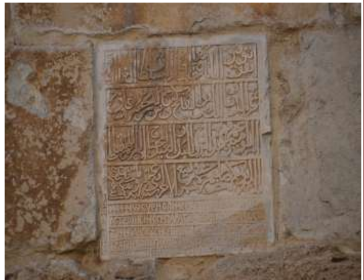
Εικόνα 5. Δίγλωσση μαρμάρινη επιγραφή σε σημείο του τείχους στην Αραβική και Ελληνική.