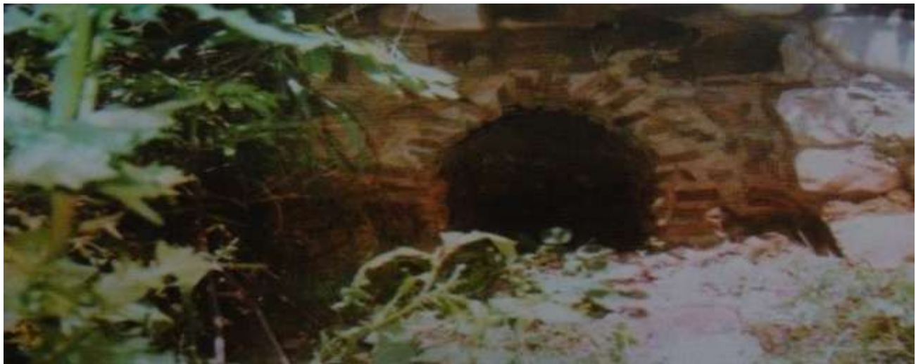
Εικόνα 19. Τα ερείπια ενός ρωμαϊκού λουτρού στη φράγκικη συνοικία του χωριού Λάλα