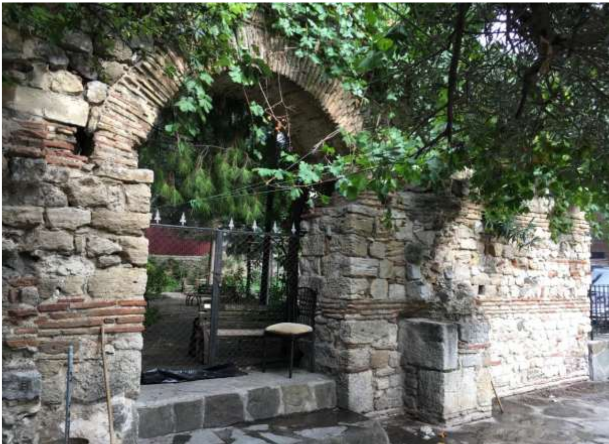
Εικόνα 6. Τοίχος στην συνοικία Μειντανκαπί ενδεχομένως να ανήκει στο δυτικό μέτωπο Εκκλησίας

Ο Ναός Σεράπιδος της Ελληνιστικής Περιόδου, που βρίσκεται στον κήπο του Αρχαιολογικού Μουσείου, είναι ένας από τους αρχαιολογικούς χώρους στο κέντρο της πόλης που μπορείτε να επισκεφθείτε μαζί με το Μουσείο, το οποίο βρίσκεται ακριβώς δίπλα του. Χτισμένος τον 4ο αιώνα π.Χ., ο ορθογώνιος ναός έχει μήκος 15 μέτρα και πλάτος 8,60 μέτρα. Το τμήμα των αλόγων, κατασκευασμένο από μαρμάρινους όγκους, βρίσκεται στη νότια πλευρά του ναού (Ναός Σεράπιδος, 2013: 36).