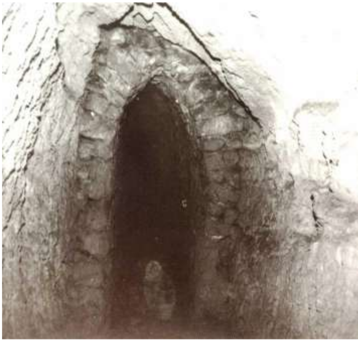
Εικόνα 16 (αριστερά). Πιθανή κρυφή υπόγεια είσοδος στα τείχη.