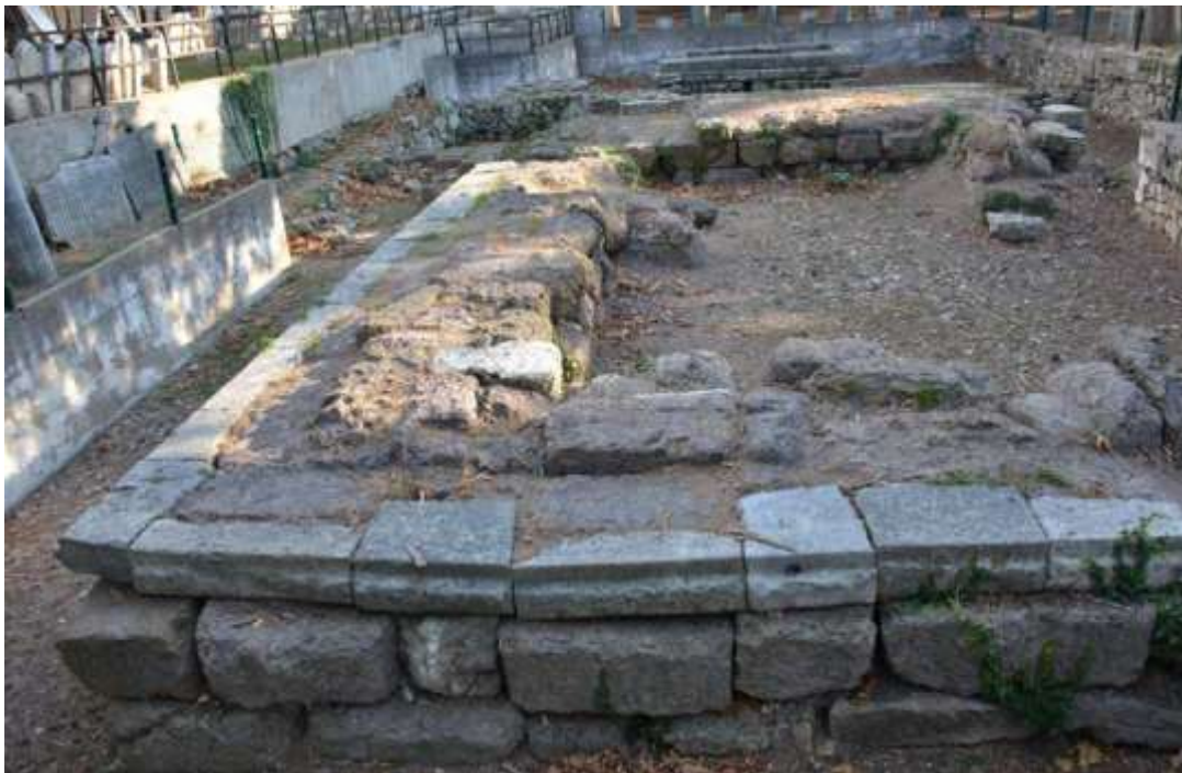
Εικόνα 7: Ναός του Σέραπι και ο βωμός στη νότια πρόσοψή του, Κήπος Αρχαιολογικού Μουσείου Σινώπης.

Το Αρχαίο Πολιτιστικό Συγκρότημα Balatlar, το οποίο είναι επί του παρόντος κλειστό για τους επισκέπτες, θα μπορούσε να συμβάλει σημαντικά στην προστιθέμενη αξία και το κύρος της Σινώπης, ανοίγοντάς το σε ντόπιους και ξένους τουρίστες. Ενώ συνεχίζονται οι αρχαιολογικές ανασκαφές και διάφορες άλλες επιστημονικές μελέτες, μπορούν επίσης να πραγματοποιηθούν τουριστικές επισκέψεις, όπως σε πολλές άλλες ανασκαφές, όπως στην Πισιδία Αντιόχεια, όπου πραγματοποιούνται ανασκαφές και διάφορες άλλες επιστημονικές μελέτες, ενώ παράλληλα μπορούν να την επισκεφθούν ντόπιοι και ξένοι τουρίστες.