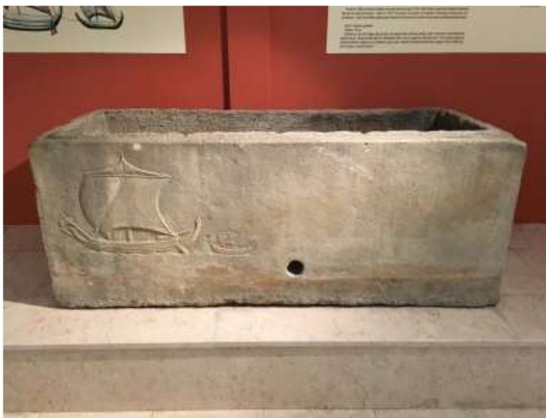
Εικόνα 9. Αίθουσα Εκθέσεων Αρχαιολογικού Μουσείου Σινώπης, Μαρμάρινη Σαρκοφάγος, 1ος-2ος αιώνας μ.Χ.