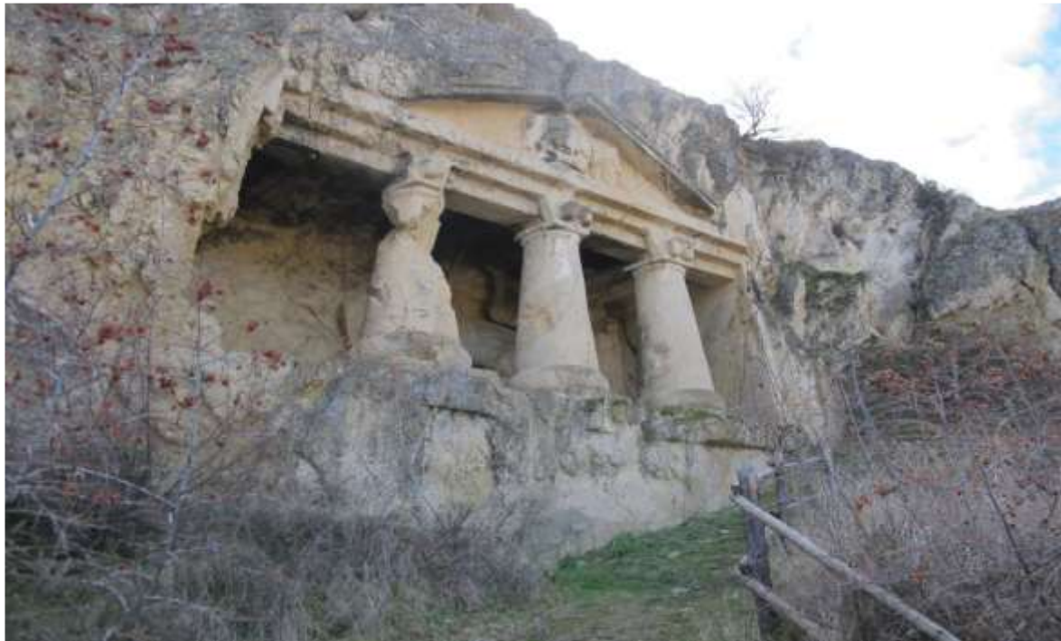
Εικόνα 21. Βραχώδης τάφος στο χωριό Salar, στην περιοχή Boyabat.