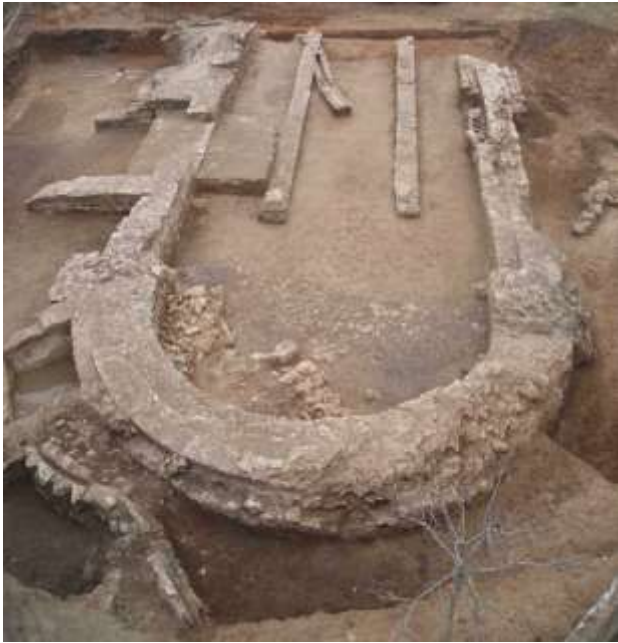
Εικόνα 14: Ερείπια Βυζαντινής Εκκλησίας στη Γειτονιά Kefeni.