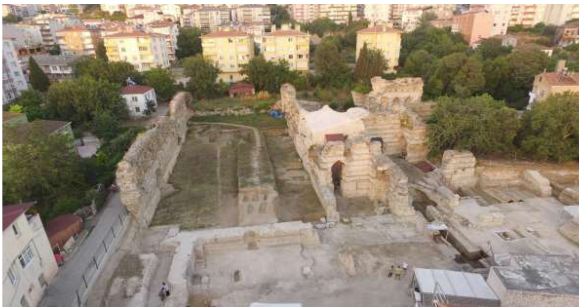
Εικόνα 10. Γενική άποψη του Αρχαίου Αρχιτεκτονικού Συγκροτήματος Μπαλατλάρ στη Σινώπη.

Η πιθανή πίσω όψη, η οποία έχει τοίχους σήραγγας όπου χρησιμοποιήθηκαν λείες πέτρες στα τμήματα εισόδου και στη συνέχεια αργολιθοδομές, έχει μήκος περίπου 192 μέτρα και ορισμένα μέρη δημιουργήθηκαν με λάξευση στους βράχους. Η πίσω όψη, με πάχος τοίχου περίπου 40-45 cm, έχει προσανατολισμό ανατολικά-δυτικά (Potern, 2013: 58). Ως αποτέλεσμα πρόσφατων μελετών που διεξήγαγε το Αρχαιολογικό Μουσείο Σινώπης, έχει προκύψει η άποψη ότι αυτή η κατασκευή μπορεί να αποτελεί στοιχείο του συστήματος ύδρευσης.