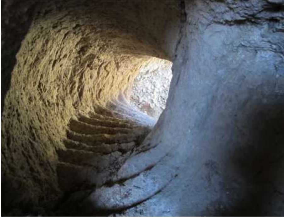
Εικόνα 22. Αρχαία σήραγγα και σκάλες που οδηγούν στα πάνω μέρη του βραχώδους τάφου στο χωριό Salar, στην περιοχή Boyabat.