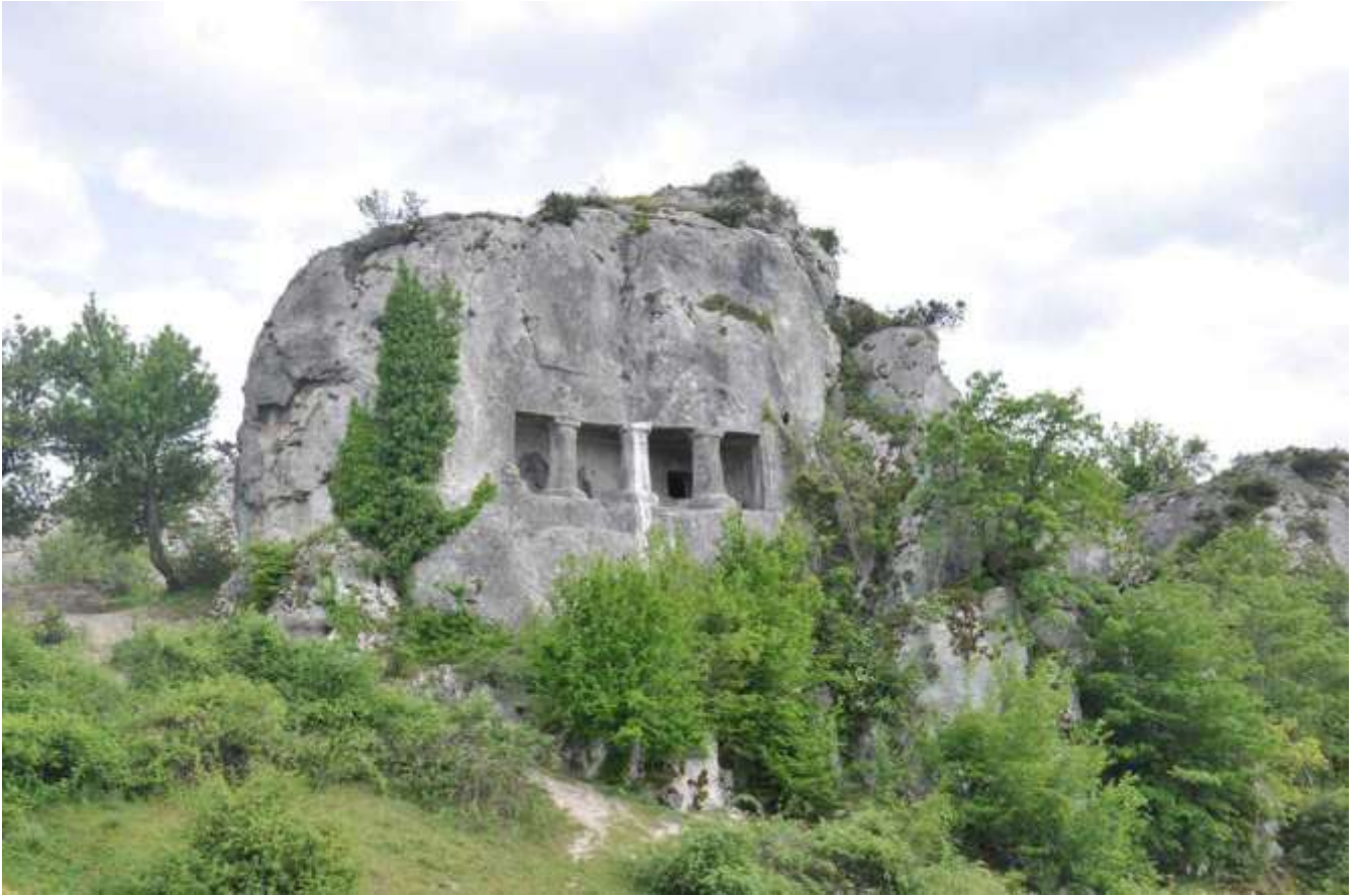
Εικόνα 24. Τάφος Terelek σε βράχο που βρίσκεται στην περιοχή Durağan