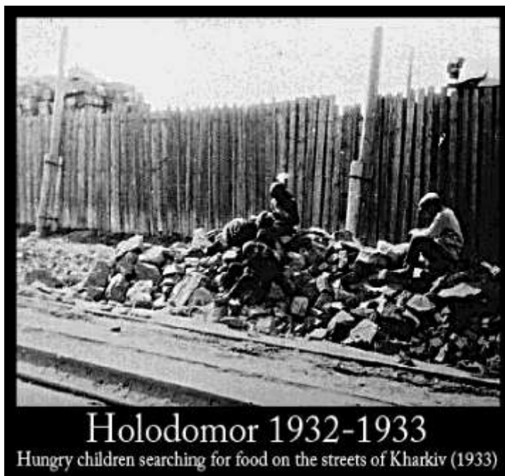
Holodomor 1932-1933 Hungry children searching for food on the streets of Kharkiv (1933)

“Τιμώμεν σήμερα την 86ην επέτειον του Χολοντομόρ, και τελούμεν ευλαβώς το μνημόσυνον των τραγικών θυμάτων της απανθρώπου ταύτης γενοκτονικής πράξεως του σταλινικού