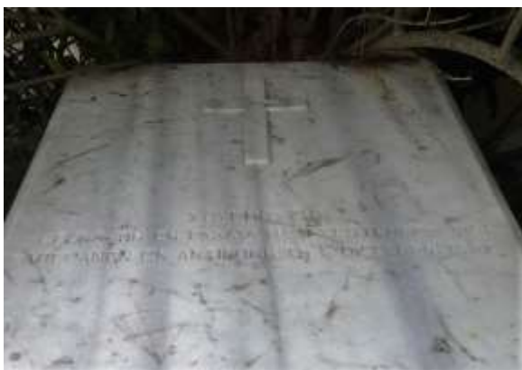
Ο τάφος του Μ. Χουρμούζη στην ν. Αντιγόνη

της σάτιρας είναι οι κύριες αρετές, που χαρακτηρίζουν και τα θεατρικά κείμενα του Χουρμούζη. Οι κωμωδίες του άλλοτε θίγουν ανθρώπινα ελαττώματα, πρόσωπα και καταστάσεις – Ο Λεπρέντης (1835), Ο Χαρτοπαίκτης (1839) – άλλοτε καυτηριάζουν τη μανία για τα λούσα, τη μόδα, την πολυτέλεια, όπως οι κωμωδίες που έγραψε στην Πόλη: Μαλακώφ (1865), Ο Οψίπλουτος (1874). Ξεχωριστή θέση στην ελληνική κωμωδιογραφία διεκδικούν οι πολιτικές σάτιρες Ο Τυχοδιώκτης (1835) και Ο Υπάλληλος (1836), όπου στηλιτεύονται χωρίς έλεος το καθεστώς της Αντιβασιλείας, οι καταχρήσεις «των ξένων» αλλά και «των εδικών μας», όπως λέει ο συγγραφέας. Πρόσφατα επιβεβαιώθηκε παράσταση μιας άγνωστης κωμωδίας του Χουρμούζη, που με τον τίτλο Ο τσαρλατάνος και το μέγα σέκρετον (ή Ο αυτεπάγγελτος ιατρός ) παίχτηκε στην Πόλη, τον Απρίλιο του 1870. Ο Λεπρέντης είναι η πρώτη πρωτότυπη