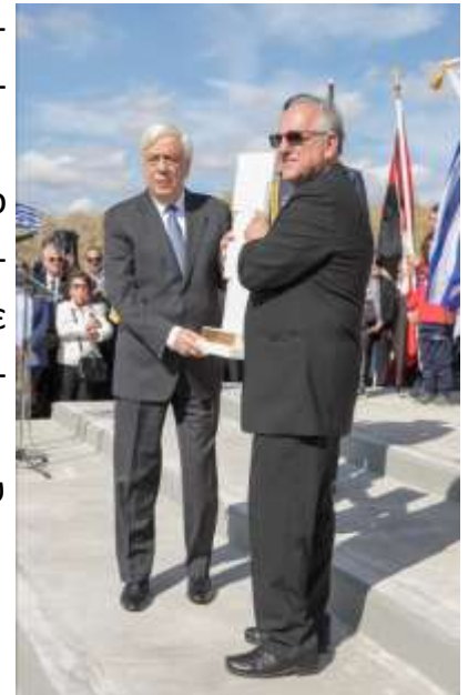
Ο Πρόεδρος της Οι.Ομ.Κω. προσφέρει ομοίωμα του Μνημείου στον Εξοχότατο Π.τ.Δ. κ. Π. Παυλόπουλο

Στην περίπτωση των Κωνσταντινουπολιτών που προσέτρεξαν αμέσως ως εθελοντές στο κάλεσμα της Ελλάδος για να υπερασπιστούν την πατρίδα – όπως το έκαναν όλοι οι Έλληνες – προβάλλει και το πρόσθετο γεγονός ότι η ανταπόκριση τους ήταν απόλυτα αυθόρμητη παρόλο το γεγονός ότι το κλίμα του ολοκληρωτισμού τον Οκτώβριο του 1940 είχε επιβληθεί παντού και η Ευρωπαϊκή ήπειρος ζούσε την πλέον μαύρη περίοδο της αφού αρκετά κράτη