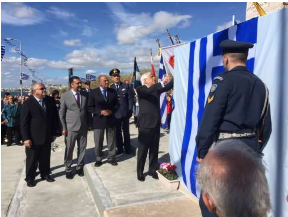
Ἡ ἀποκάλυψη τοῦ Μνημείου ἀπὸ τοῦ Ἐξοχότατο Πρόεδρο τῆς Ἑλληνικῆς Δημοκρατίας κ. Προκόπη Παυλόπουλος

βιθ' Νοεμβρίου α' Ἐπισημασθέντος ὡς ἀποκαλυπτήρια ἡμετέρας ἀποφάσεως ἀποκαλύψαι τὸν ἀποκαλυπτήριον τοῦ Μνημείου ἀπὸ τοῦ ἐξοχότατου Προέδρου τῆς Ἑλληνικῆς Δημοκρατίας κ. Προκόπη Παυλόπουλος