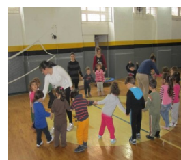
Επίσκεψη στον Α.Σ. Πέρα

εξέλιξη για την Παιδεία της Ομογένειας. Το εκπαιδευτικό προσωπικό του Εργαστηρίου εφαρμόζοντας σύγχρονες μεθόδους αγωγής των νηπίων προσφέρει πολύ σημαντικές υπηρεσίες στα πλαίσια αυτής της προσχολικής εκπαιδευτικής διαδικασίας με έμφαση την βελτίωση της ελληνομάθειας.