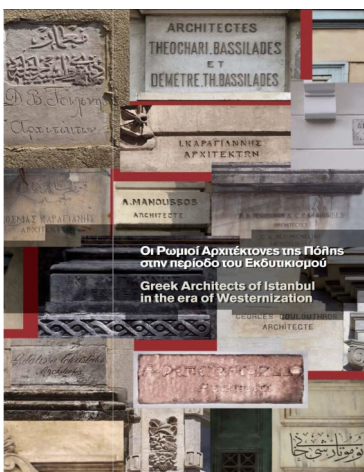
Οι Ρωμιοί Αρχιτέκτονες της Πόλης στην περίοδο του Εκδυτικισμού Greek Architects of Istanbul in the era of Westernization